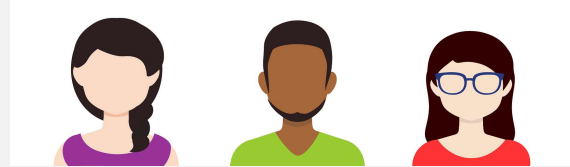
Illustration von Bild von Coffee Bean auf Pixabay (b)