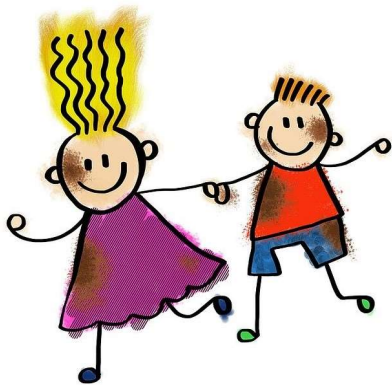
Illustration von Prawny auf Pixabay

Diese Frage stellten wir Ihnen in diesem Sommer – und das haben Sie geantwortet: