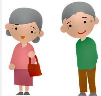
Illustration von Please Don't sell My Artwork AS IS auf Pixabay

Insgesamt haben 35 Menschen zwischen acht und 91 Jahren an der Postkarten-Aktion teilgenommen. Vielen Dank! 😊