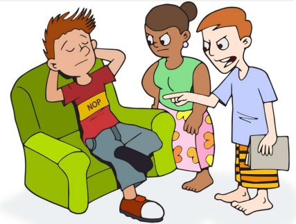
Illustration von CoxinhaFotos auf Pixabay