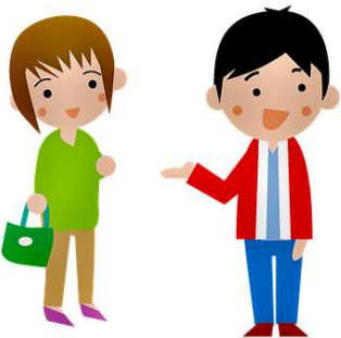
Illustration von Please Don't sell My Artwork AS IS auf Pixabay